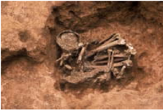
写真1 近世墓(側臥屈葬)