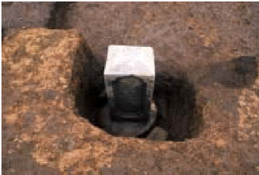
写真3 墓標転用礎石